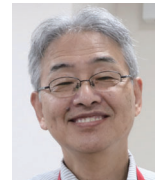
社会福祉法人 岡山博愛会 法人本部 事務局長

「永遠に完成しない場所」病院と、これからも先の見えない時代に、デザインの力が医療の進化の一助となり、完成に向かっていけることを期待しています。